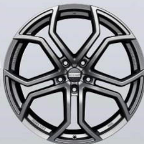
9XR superlight titanium matt