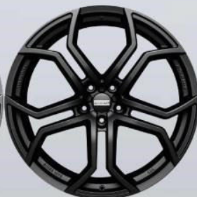
9XR superlight black matt