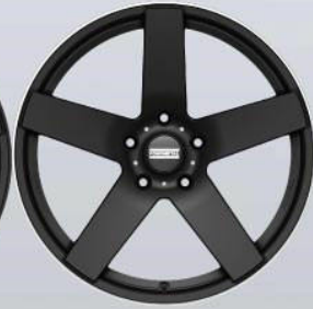
STC-02 black-DL matt / glossy Rand-poliert