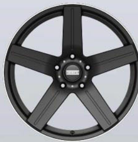
STC-01 glossy-black-DL Rand-poliert