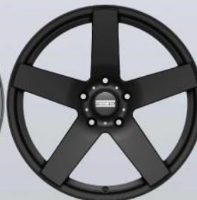
STC-02 black matt / glossy