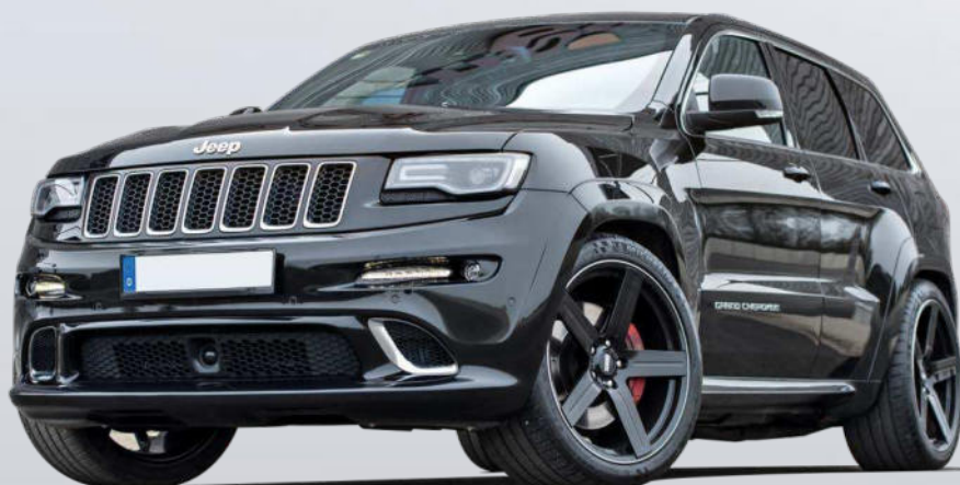
Jeep Gr. Cherokee SRT auf STC-01/C 11,0x22"