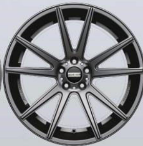
STC-10 titanium matt / glossy