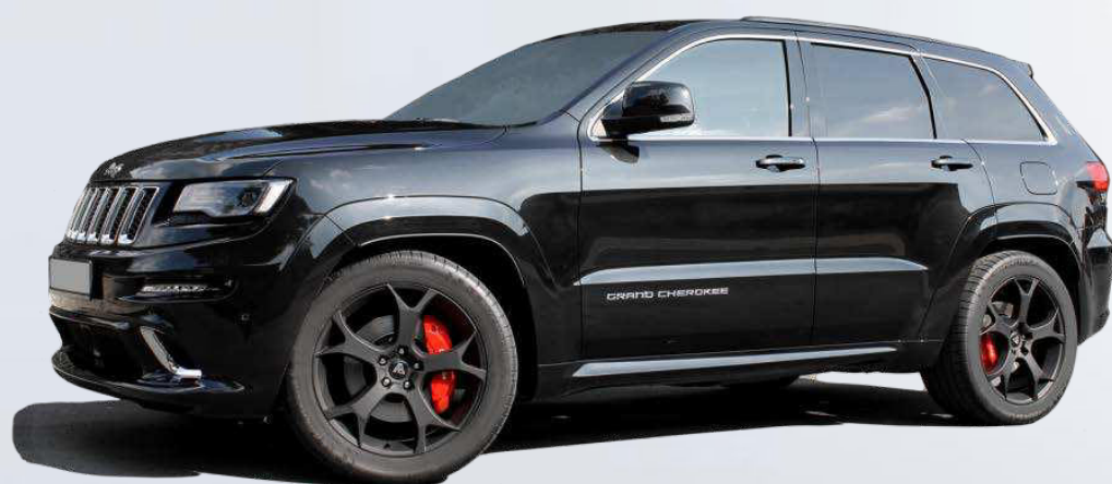
Jeep Gr. Cherokee SRT auf GHOST.5

Alle Felgen auf Anfrage auch ohne Bereifung erhältlich !