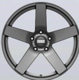
STC-02 titanium matt / glossy