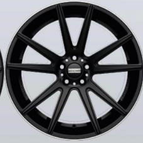
STC-10 black-DL matt / glossy Rand-poliert