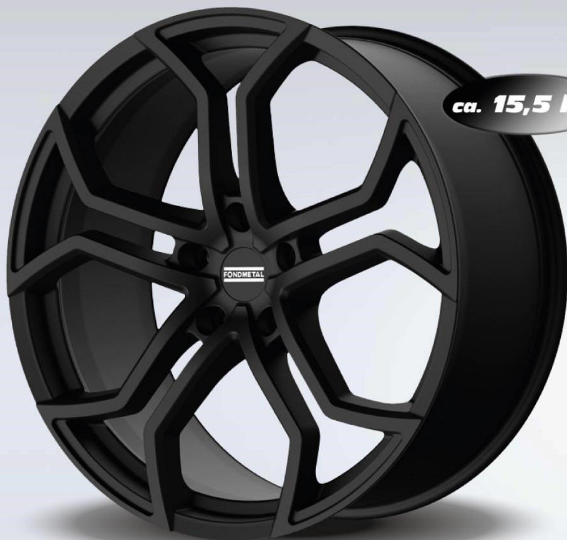
9XR superlight black matt