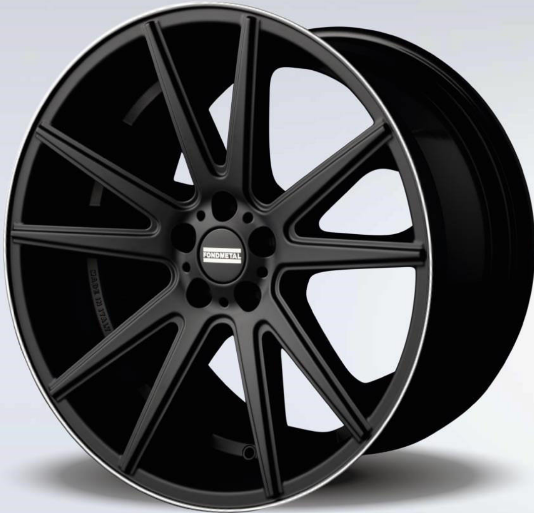
STC-10 glossy-black-DL Rand-poliert