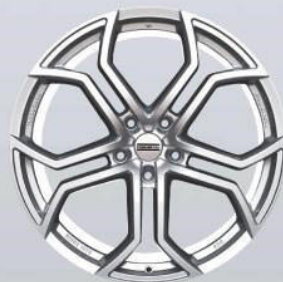
9XR superlight silver