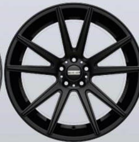
STC-10 black matt / glossy