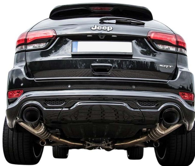
Jeep Gr. Cherokee SRT